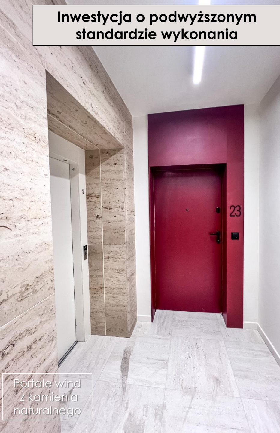
Portale wind z kamienia naturalnego