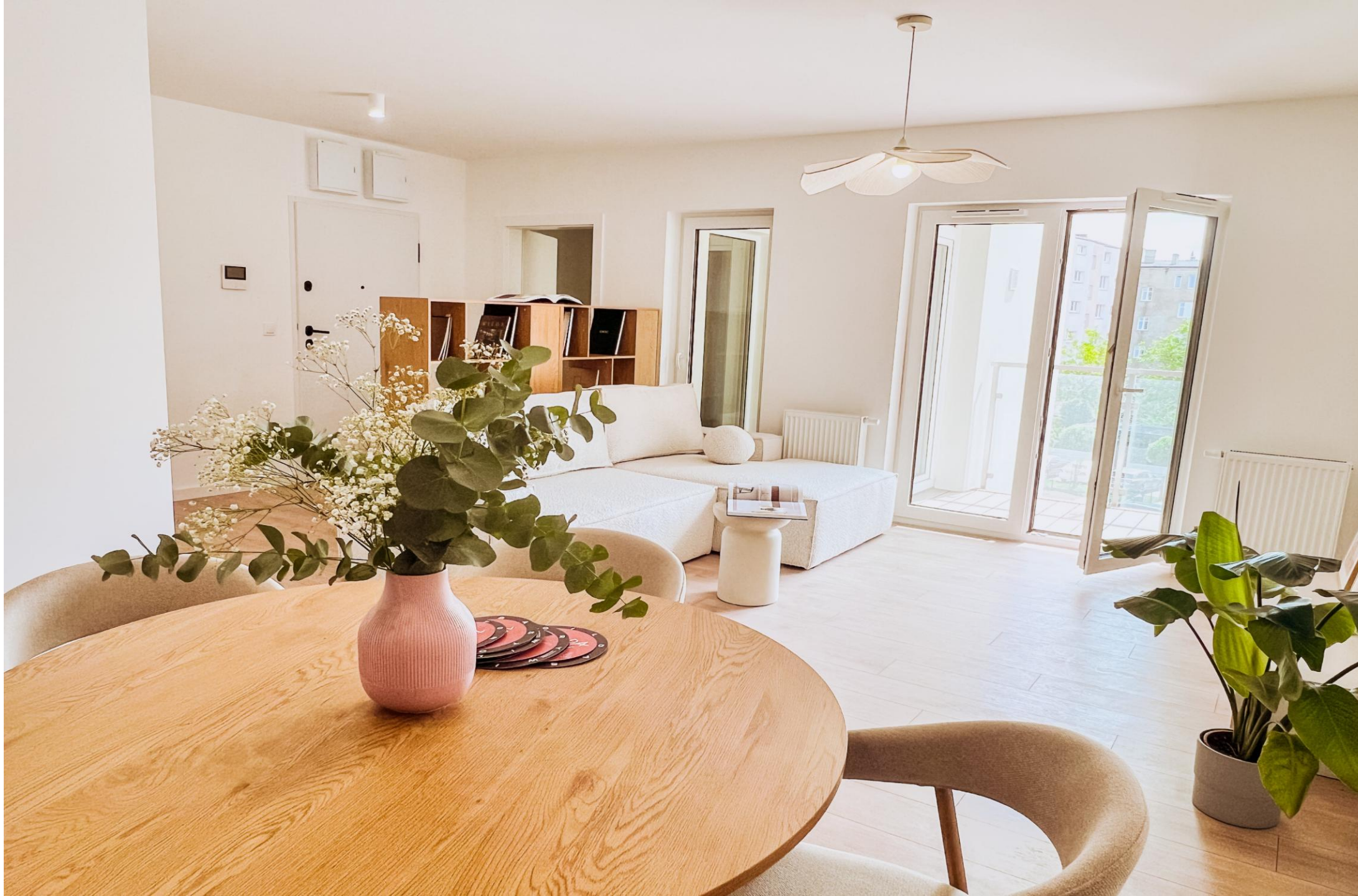
Salon z aneksem kuchennym