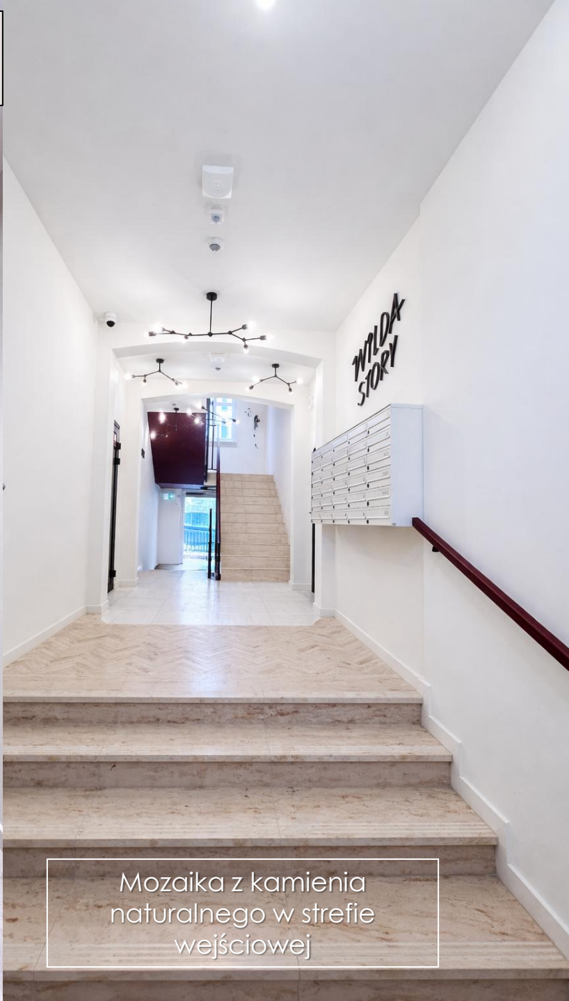
Mozaika z kamienia naturalnego w strefie wejściowej